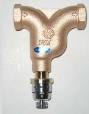
※写真はスプリン継手にヘッド本体取付